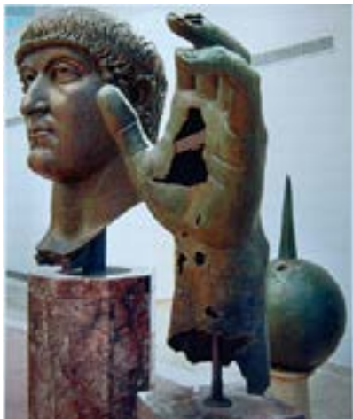
Reste einer Kolossalstatue von Konstantin

Ein weiterer wichtiger Beschluss des Konzils von Nicäa betraf das Osterfest. Ostern ist das älteste und wichtigste Fest der Christenheit. Es erinnert an die Mitte des christlichen Glaubens: die Auferstehung Jesu Christi von den Toten nach seinem Leiden und Sterben am Kreuz. Das Osterfest ist da-