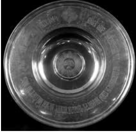
Taufschale aus 1901 mit Inschrift: "Lasset die Kinder zu mir kommen und wehret ihnen nicht, denn solcher ist das Reich Gottes; Ev. Marc. 10,14"

Bei der Taufe eines Kindes ist die Entscheidung der Eltern ausschlaggebend. Für die Taufe Jugendlicher oder Erwachsener ist der eigene Entschluss maßgeblich. Die für die Kindertaufe notwendigen Paten müssen einer christlichen Kirche angehören. Mindestens einer von ihnen soll evangelisch sein. Evangelische Christen können ab dem Zeitpunkt ihrer Konfirmation ein Patenamts übernehmen. Eltern, die keiner christlichen Kirche angehören, können den Wunsch haben, ihr Kind taufen zu lassen. Ob das möglich ist, entscheidet das Presbyterium der Kirchengemeinde. In diesem Fall haben die Paten eine besonders wichtige Rolle. Die Taufe begründet rechtsgültig die Mitgliedschaft in der Evangelischen Kirche. Wer aus einer christlichen Kirche ausgetreten ist, wird bei einem erneuten Kircheneintritt nicht mehr getauft. Die Taufe behält ihre Gültigkeit während des ganzen Lebens. Die Taufen werden seit dem 1. Ad-