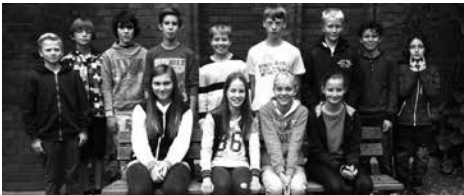
KonfirmandInnen im Jahr 2014

In der Zeit vom 18. auf den 19.03.2016 unternehmen unsere Konfis ihre Schlussfahrt, die sie diesmal in die von Bodelschwingsche Stiftung Bethel nach Bielefeld führt. Dort lernen sie insbesondere die Brockensammlung kennen. Die Brockensammlung blickt auf eine lange Tradition zurück, denn sie wurde bereits 1890 gegründet. Durch die blauen Kleidercontainer auf dem Parkplatz der Dreifaltigkeits-Gemeinde hat sie auch in Eppenhause einen hohen Bekanntheitsgrad. In jedem Monat werden durch die drei Container 1.500 bis 3.000